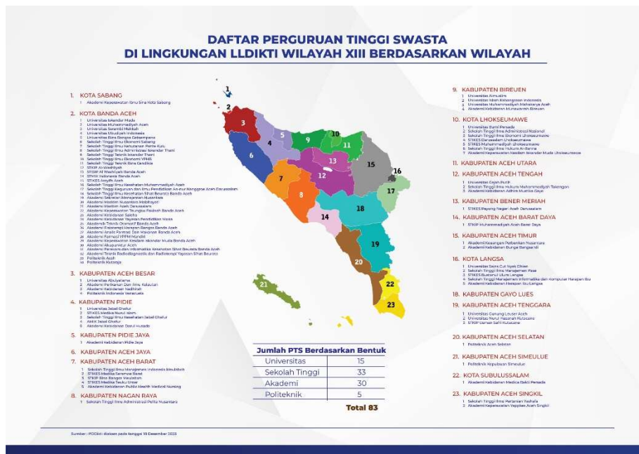
Gambar 1.1 Sebaran Perguruan Tinggi

LLDIKTI Wilayah XIII merupakan satuan kerja yang bertanggung jawab kepada Menteri Pendidikan, Kebudayaan, Riset, dan Teknologi dalam menyelenggarakan fasilitas mutu perguruan tinggi di provinsi Aceh. LLDIKTI Wilayah XIII terus menerus mengupayakan peningkatan mutu perguruan tinggi di lingkungan kerjanya, dengan memberikan layanan dan kemudahan serta menjamin terselenggaranya pendidikan yang bermutu tanpa diskriminasi. Saat ini perguruan tinggi di lingkungan LLDIKTI Wilayah XIII adalah sejumlah 83 (delapan puluh tiga) yang tersebar pada 23 (dua puluh tiga) Kabupaten/Kota di provinsi Aceh.