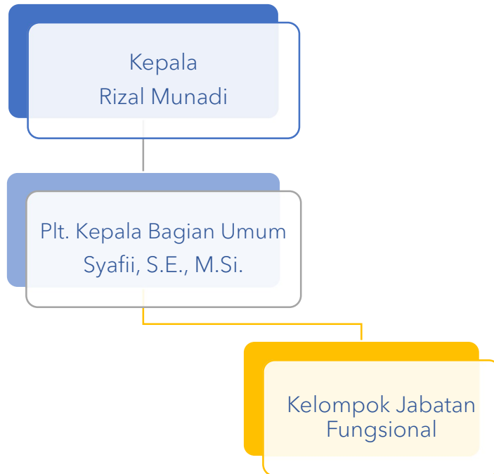
Gambar 3.2 Struktur Organisasi

Berdasarkan Peraturan Menteri Pendidikan, Kebudayaan, Riset, dan Teknologi Nomor 35 Tahun 2021 tentang Organisasi dan Tata Kerja Lembaga Layanan Pendidikan Tinggi, struktur LLDIKTI Wilayah XIII adalah sebagai berikut: